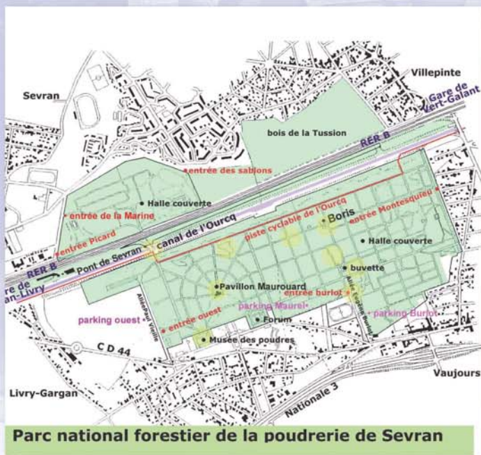
Parc national forestier de la poudrerie de Sevrans

Pour les groupes, visite commentée, sur rendez-vous, contactez "LES AMIS DU PARC DE LA POUDRERIE".